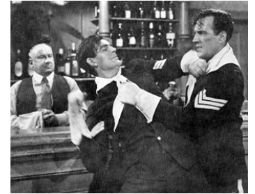
1944 L'ATTAQUE DE LA MINE (Boss of Boomtown) de Ray Taylor avec Rod Cameron