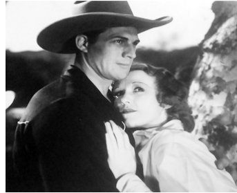
1932 THE MAN FROM NEW MEXICO de John P. McCarthy avec Caryl Lincoln