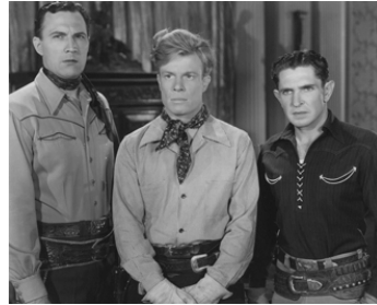
1942 LA PISTE INFÉRNALE (Thundering Trails) de John English avec Jimmie Dodd, Bob Steele