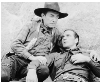
1935 LA LUTTE POUR LE RANCH (Powdersmoke Range) de Wallace Fox avec Harry Carey