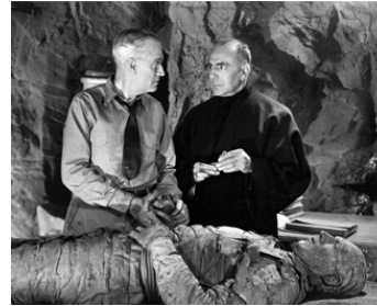
1940 LA MAIN DE LA MOMIE (The Mummy's Hand) de C. Cabanne avec C. Trombridge, G. Zucco