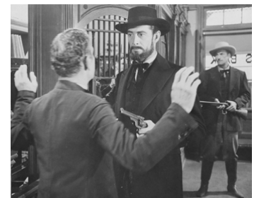
1949 J'AI TUÉ JESSE JAMES (I shot Jesse James) de Samuel Fuller avec S. Price, Reed Hadley