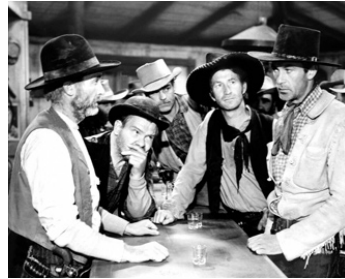
1940 LE CAVALIER DU DÉSERT (The Westerner) de W. Wyler avec W. Brennan, Gary Cooper