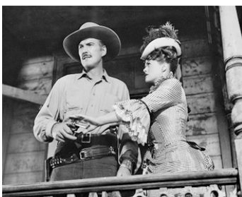
1949 LE GANG DES 4 FRÈRES (Younger Brothers) d'Edwin L. Marin avec Janis Paige