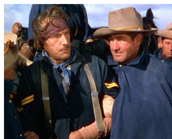
1949 LA CHARGE HÉROÏQUE (She wore a yellow Ribbon) de John Ford avec Fred Graham