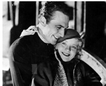
1933 DEADWOOD PASS de J. P. McGowan avec Terry Walker