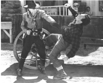
1941 RIDERS OF THE TIMBERLINE de Lesley Selander avec William Boyd