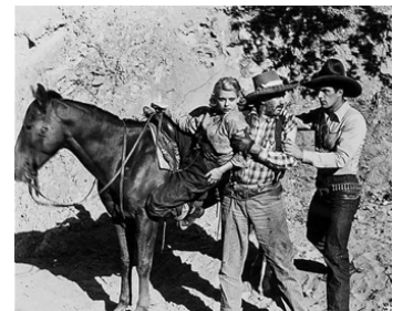
1934 TERROR OF THE PLAINS d'Harry S. Webb avec Roberta Gale, Slim Whitaker