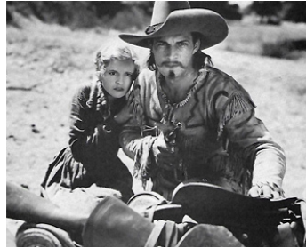
1931 BUFFALO BILL (Battling with Buffalo Bill) de Ray Taylor avec Lucile Browne