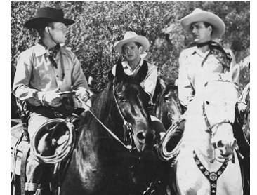
1942 LA VALLÉE DES HOMMES TRAQUÉS de John English avec Jimmie Dodd, B. Steele