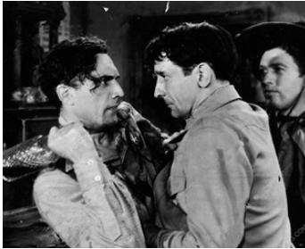
1940 LIGHT OF WESTERN STARS de Lesley Selander avec Victor Jory