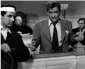
1942 LA JUSTICE DES HOMMES (The Talk of the Town) de G. Stevens avec Cary Grant, R. Colman