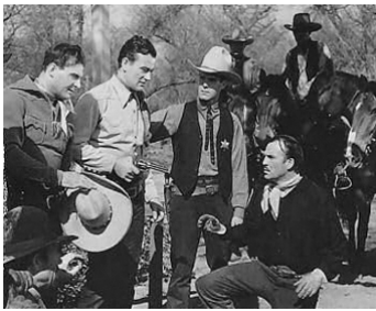
1939 LES CAVALIERS DE LA NUIT (The Night Riders) de G. Sherman avec Kermit Maynard, J. Wayne