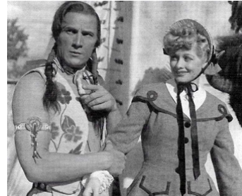
1942 LA VALLÉE DU SOLEIL (Valley of the Sun) de George Marshall avec Lucille Ball