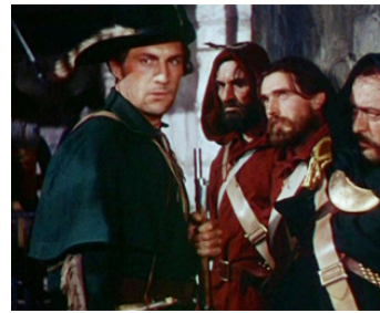
1939 SUR LA PISTE DES MOHAWKS (Drums along the Mohawk) de John Ford