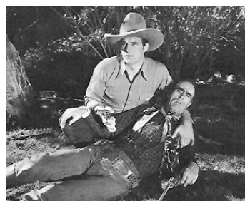
1935 CONTRE LES BANDITS (Born to Battle) d'Harry S. Webb avec Nelson McDowell