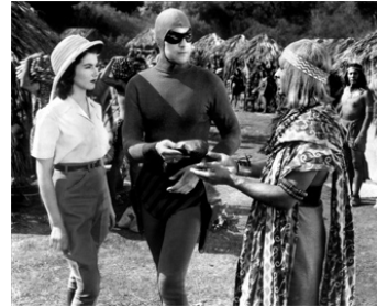
1943 LE FANTÔME DU BENGALE (The Phantom) de B. Reeves Eason avec Jeanne Bates