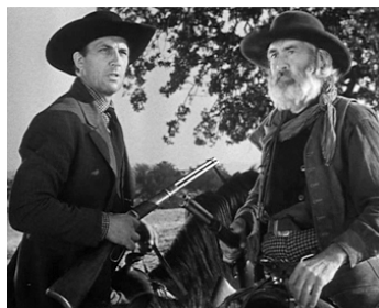
1946 LA VILLE DES SANS LOI (Badman's Territory) de Tim Whelan avec George Gabby Hayes