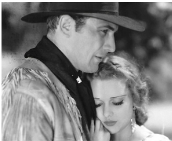
1933 WAR OF THE RANGE de J. P. McGowan avec Caryl Lincoln