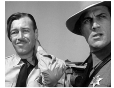
1940 LES RAISINS DE LA COLÈRE (The Grapes of Wrath) de John Ford avec Norman Willis