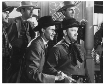
1939 L'AIGLE DES FRONTIÈRES (Frontier Marshal) d'Allan Dwan avec L. Chaney Jr, J. Carradine