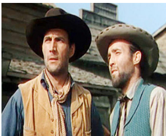
1945 SAN ANTONIO (San Antonio) de David Butler avec John Alvin